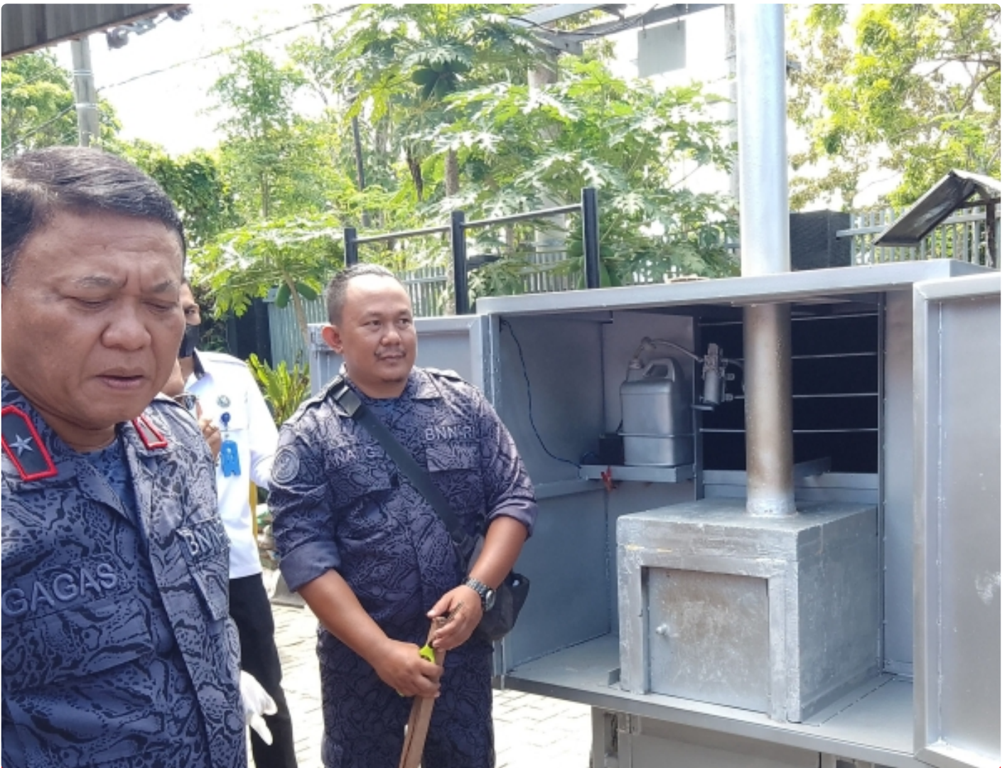
Kepala BNNP NTB saat pemusnahan BB sabu dengan mesin insenerator. (10/11)

Mataram NTB - Menindak lanjuti peraturan perundang-undangan terkait pemusnahan barang bukti narkotika yang disita dari hasil penindakan atas Peredaran gelap Narkotika, Badan Narkotika Nasional Provinsi Nusa Tenggara Barat (BNNP NTB) melakukan pemusnahan Barang Bukti hasil pengungkapan